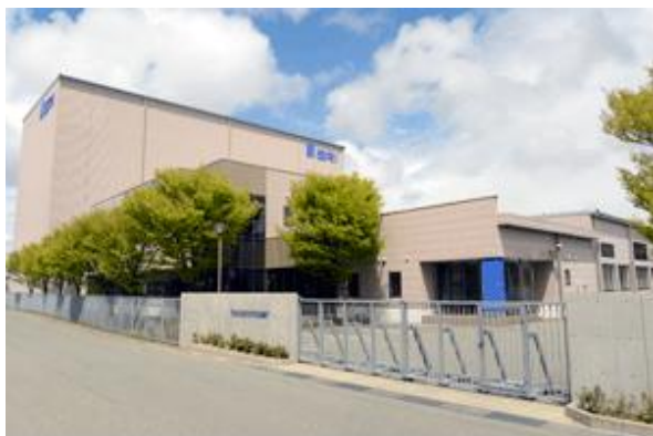
SRI情報管理センター