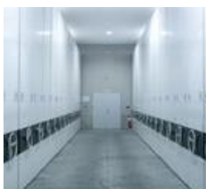
機密文書保管エリア