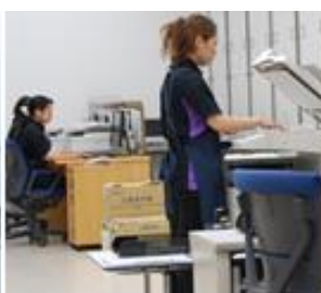
電送・電子エリア