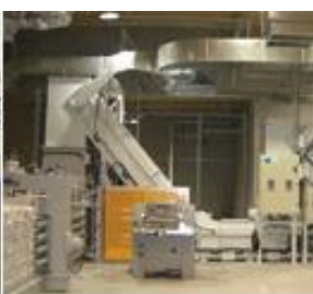
機密破砕処理エリア